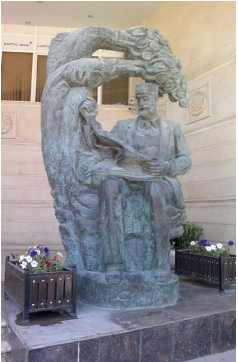
Памятник Г.Б. Зардаби в Баку

В этой заметке подводятся некоторые итоги первого года издания газеты «Экинчи». Итоги не радужные. Газета к исходу первого года имеет всего 283 читателей, имеющих годовую подписку. Те, кто имел полугодовую подписку, ее пока не продлили. Большинство подписчиков представляет северные районы Азербайджана. Названы Губа, Дербенд. Печально, что в городе Гяндже, имеющем славные древние культурные традиции, только один человек имеет подписку на «Экинчи». Автор заметки недоумевает: объем газеты увеличен, круг тем расширен, даже бумага стала лучше, а жалающих оформлять подписку стало меньше. «Некоторые говорят: пиши такое, от чего нам была бы польза хоть на копейку. Выходит, что они копейку, то есть собственную выгоду ставят выше интересов нации. Вы, братья, продающие собственный народ за копейку, называя себя мусульманами, ставите под сомнение приверженность исламу других. Горе вам, так как из всех требований к мусульманству вы знаете только молитву и пост», - с горечью заключает автор, коим, скорее всего является сам Гасан бек Зардаби.