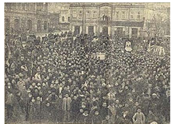
Похороны Г.Б. Зардаби. Баку 28 ноября 1907 год

Bir il tamamdır ki, bizim qəzet çap olunur. Ona binaən lazım bilirik ki, bu bir ilin hesabına gedək. Keçən ili rəcəbin əvvəlindən təzə iləcən bizim 600-cən müştərimiz var idi. Bu il indiyəcən 283 bir illik, 57 yarım