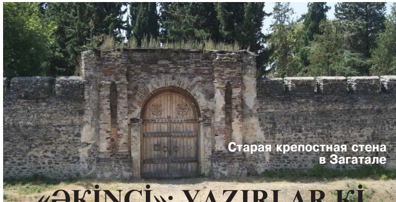
Старая крепостная стена в Загатале