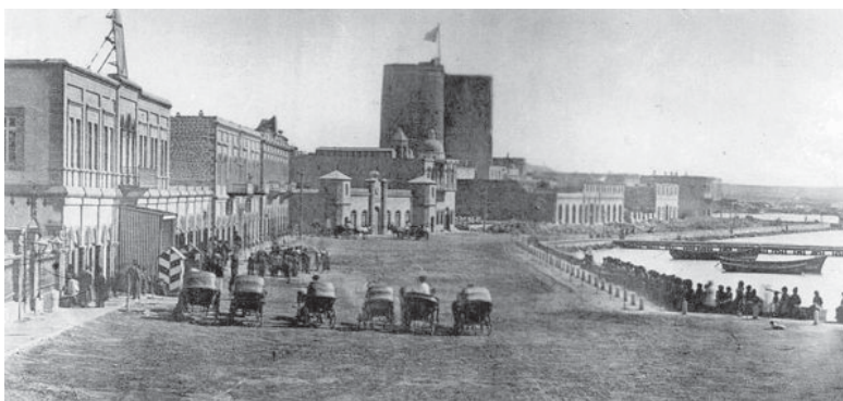
Баку в 1870-е годы