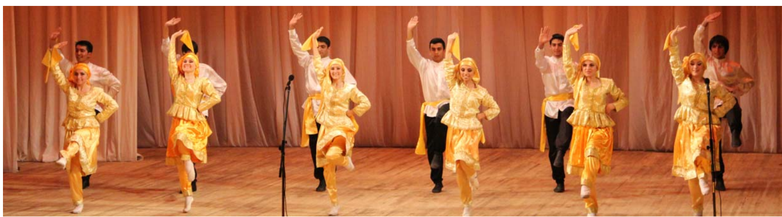
(Окончание. Начало на стр. 1.)