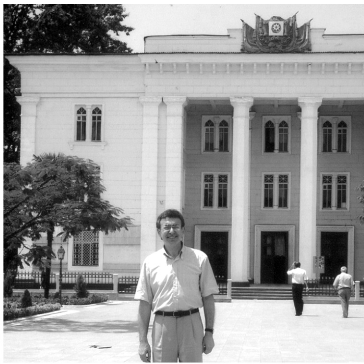
2006 год. Ленкорань, Дом Офицеров.